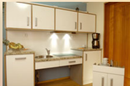
Küchenzeile höhenverstellbar und unterfahrbar