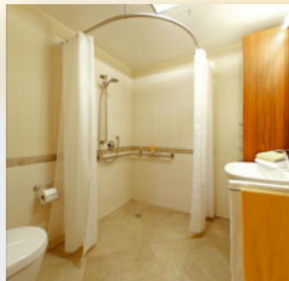
Große befahrbare Dusche mit Duschsitz