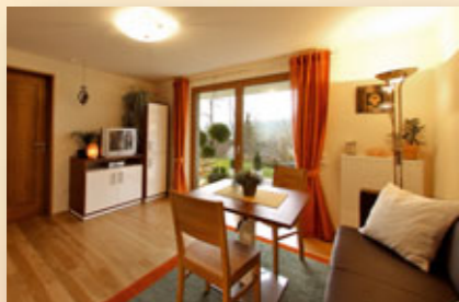
Wohnküche mit Zugang zur Gartenterrasse