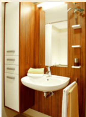
Waschtisch höhenverstellbar und unterfahrbar