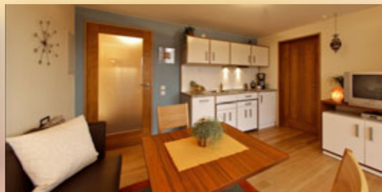
Wohnküche mit Dinnersofa (Sitzhöhe!), Tisch höhenverstellbar, Sat-TV mit Video, DVD-Player