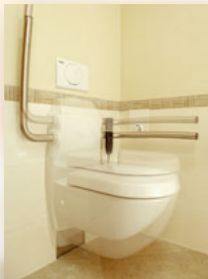
Höhenverstellbares WC mit Haltegriffen